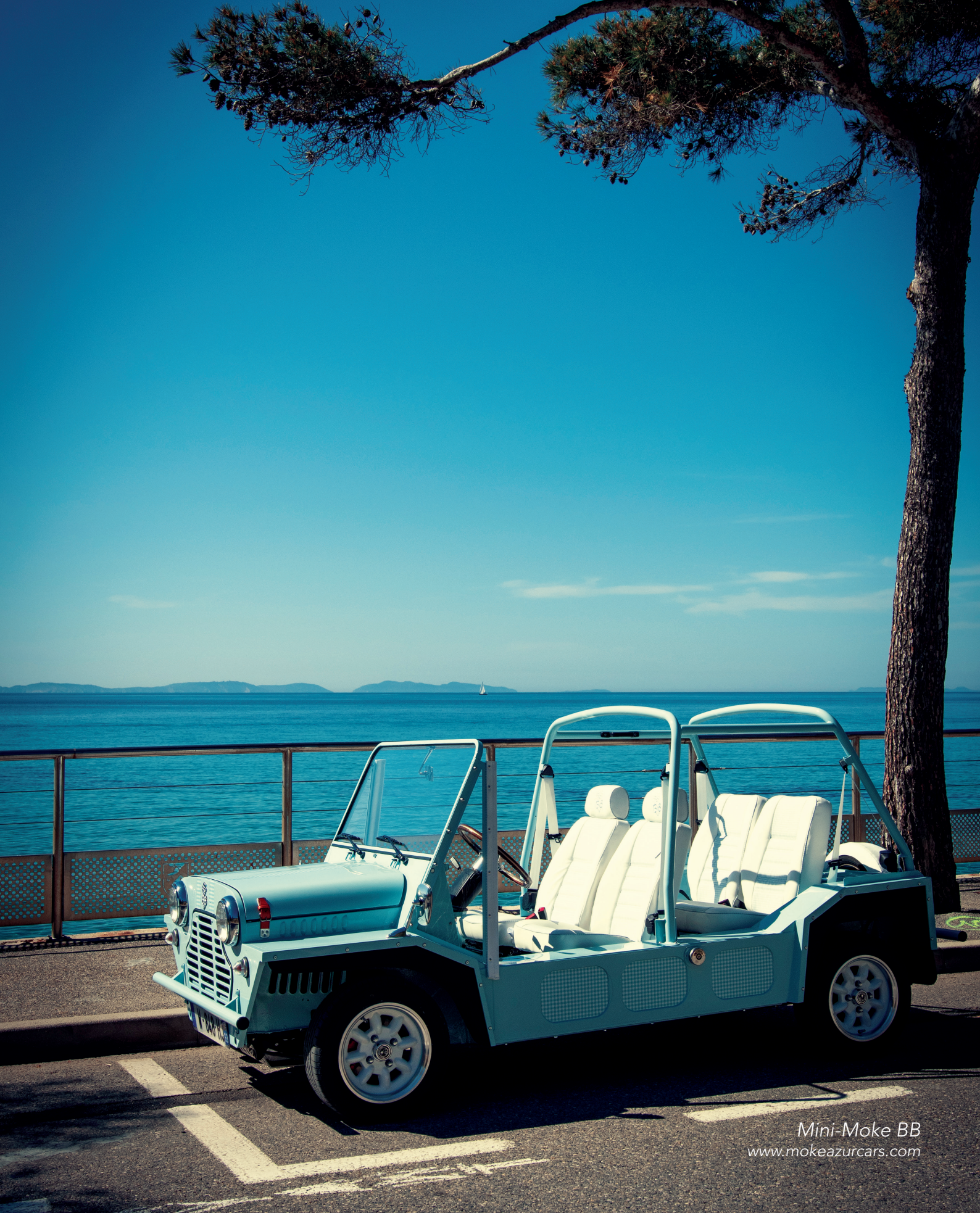
Mini-Moke BB www.mokeazurcars.com