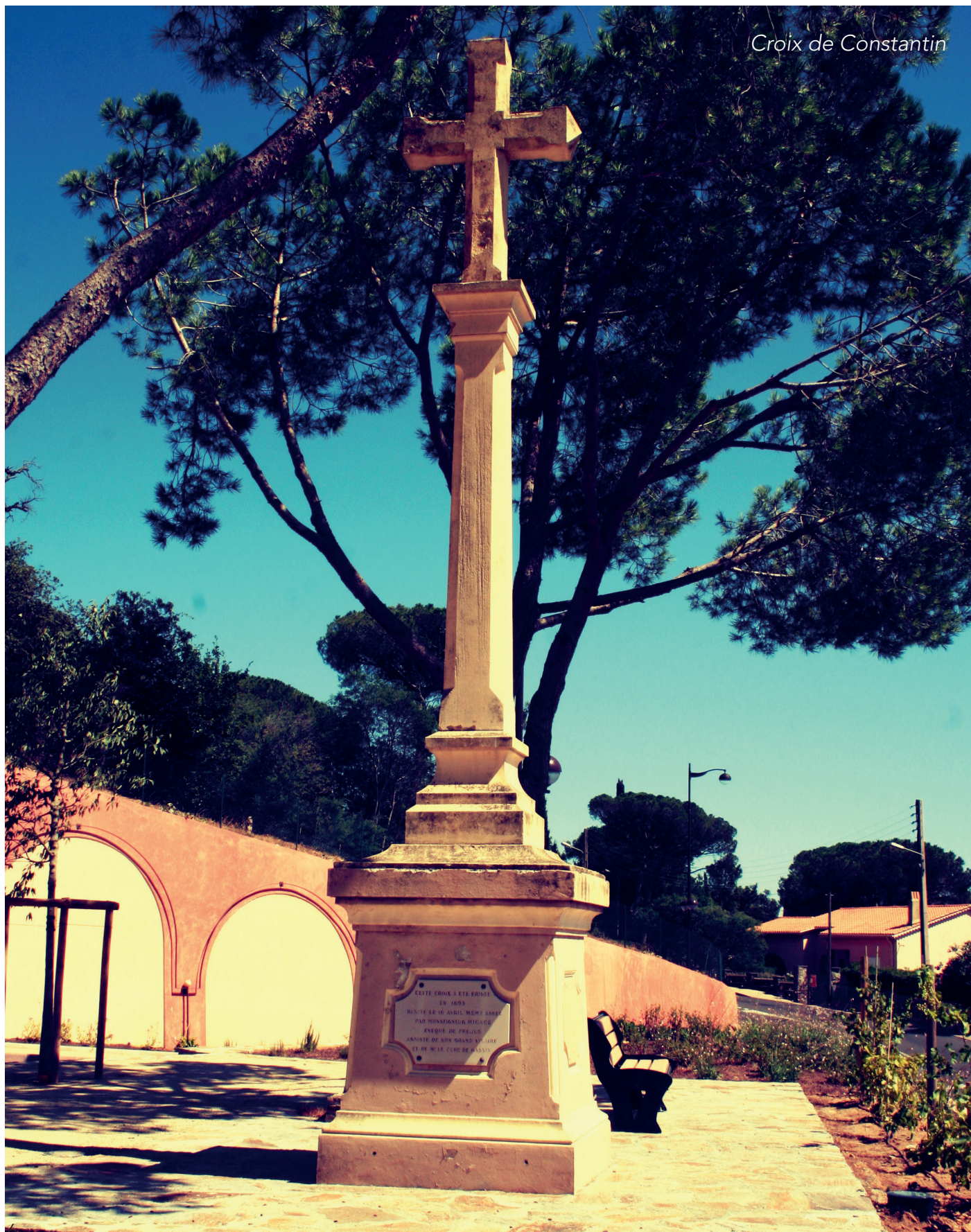
Croix de Constantin