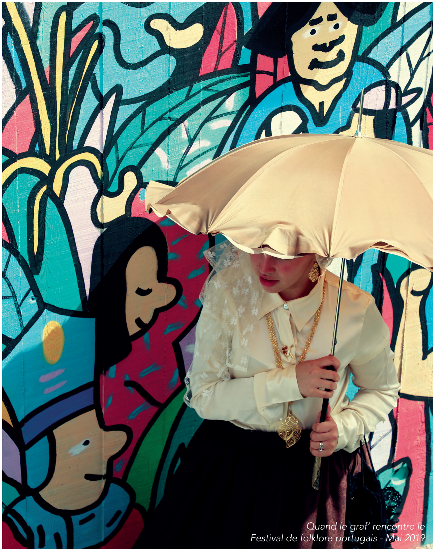
Quand le graf' rencontre le Festival de folklore portugais - Mai 2019