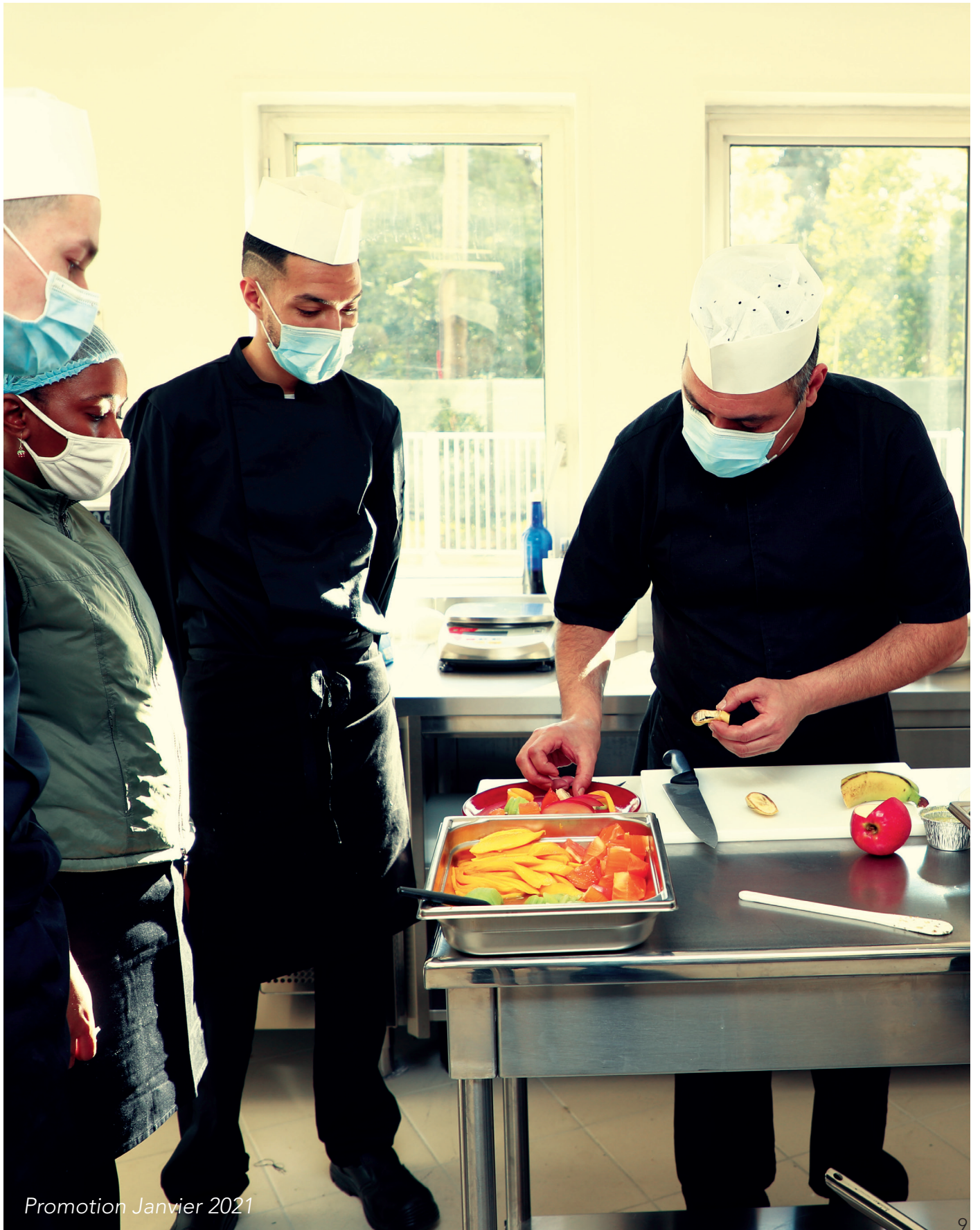
Promotion Janvier 2021